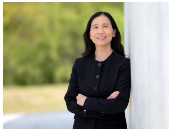
Dre Theresa Tam - Administratrice en chef de la santé publique du Canada

Pendant la Semaine nationale de promotion de la vaccination, je pense qu'il est particulièrement important de souligner que le déploiement des vaccins contre la COVID-19 a constitué la campagne de vaccination la plus importante et la plus complexe jamais menée dans ce pays. La grande majorité des personnes vivant au Canada (plus de 85 %) ont reçu deux doses d'un vaccin contre COVID-19, ce qui nous a permis d'atteindre des niveaux élevés de vaccination.